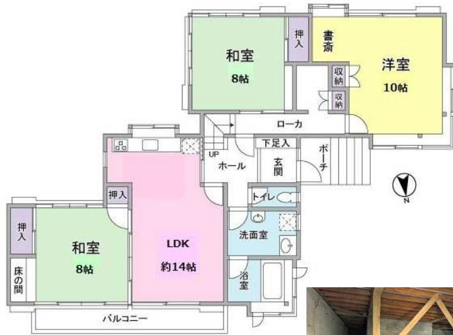
※図面と現況が異なる場合は現況を優先します