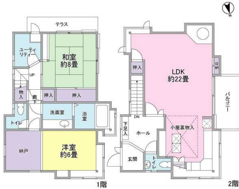
※図面と現況が異なる場合は現況を優先します。