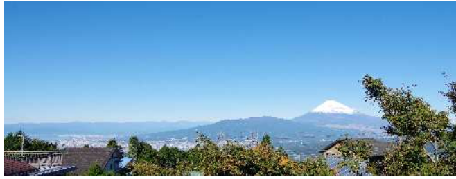
[小屋裏部屋より撮影]